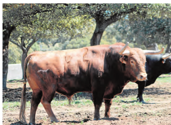
Mirador, número 62. Colorado, ojo perdiz de capa.