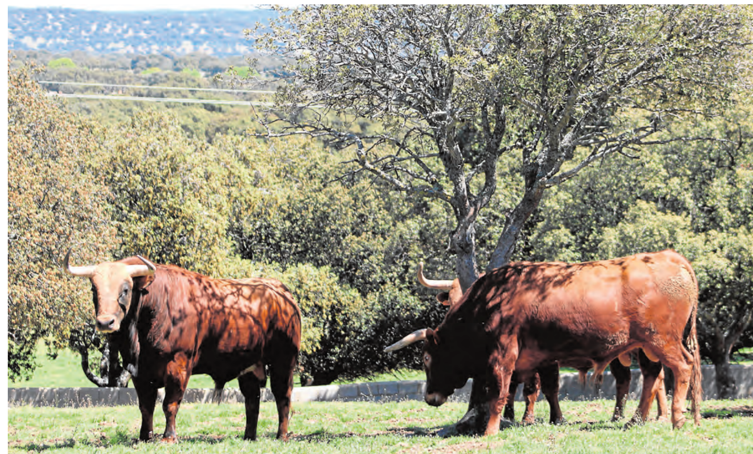
Tres toros de la ganadería de El Pilar, en uno de los cercados de la finca de El Puerto de la Calderilla.