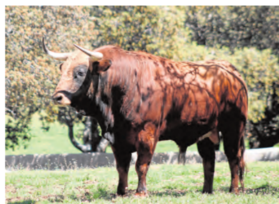
Portillo, número 84. Castaño ojinegro.