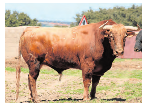
Resistente, número 145. Colorado ojo de perdiz.