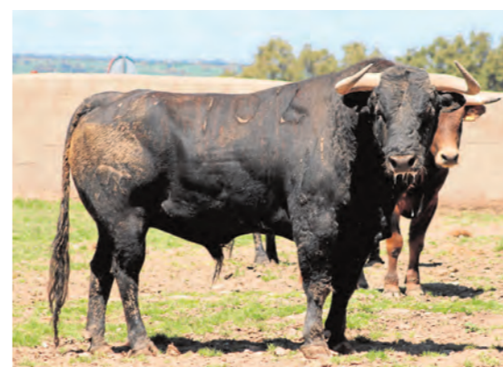
Medicina, número 102. De pelo negro chorreado.