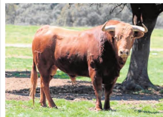
Tontillo, número 59. De pelo colorado y ojo de perdiz.