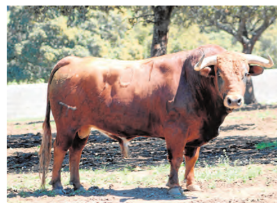
Alambrisco, número 107. Castaño, ojinegro y bociblanco.