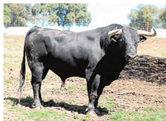
Niñito, número 91; negro de capa.